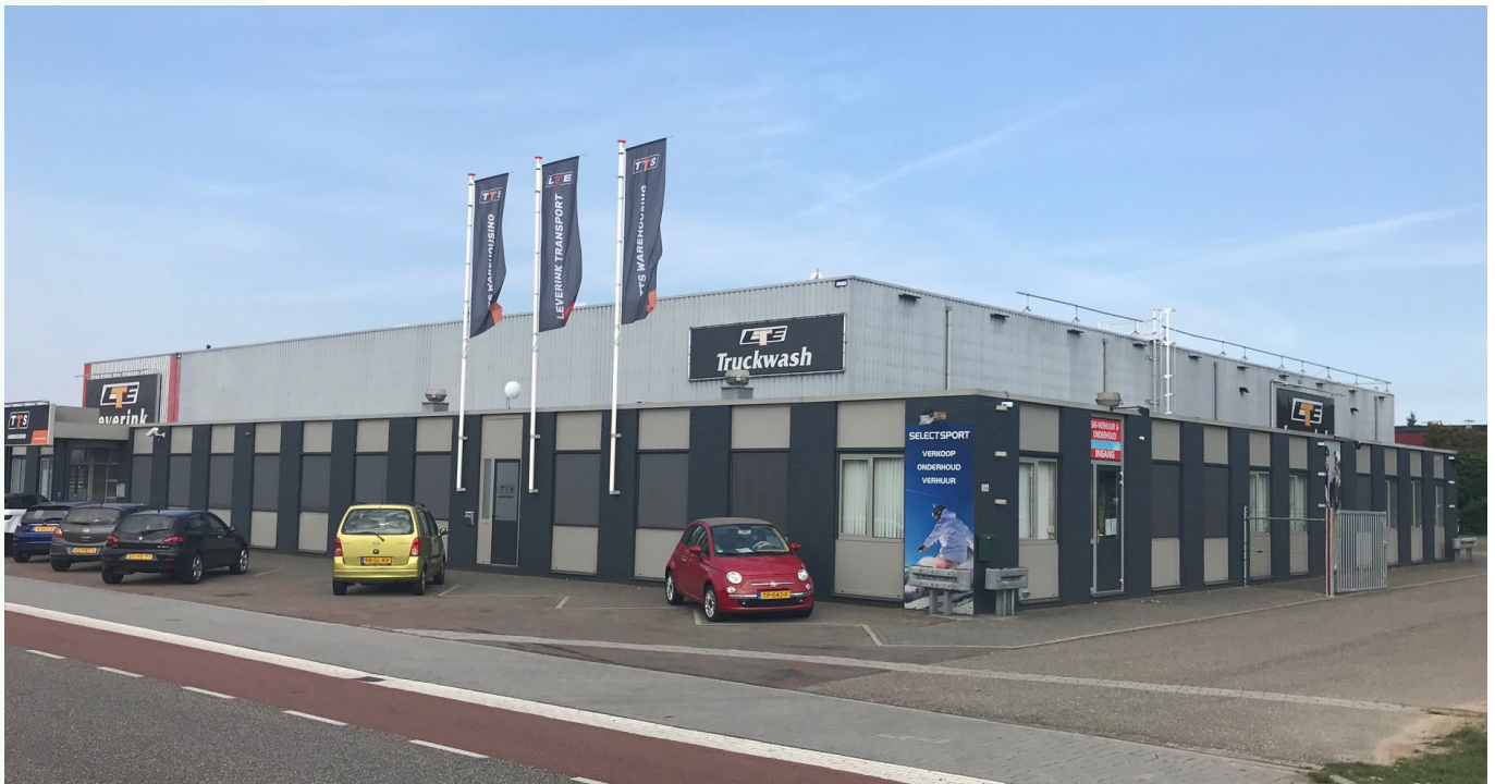
Na Voortman Steel Group is het dak van dit pand van Leverink Transport aan de Spoelerstraat gecontracteerd voor het beleggen met circa 1.250 zonnepanelen.

hiermee aan een stukje lokale zelfvoorziening. Het perspectief dat de RVT biedt om lokaal de transitie naar groene energie vorm te geven en het feit dat deelname aan de coöperatie een gemiddeld huishouden al gauw een voordeel van € 100 tot € 200 per jaar oplevert, heeft het coöperatiebestuur gestimuleerd om een postcoderooscoöperatie in Rijssen op te richten.